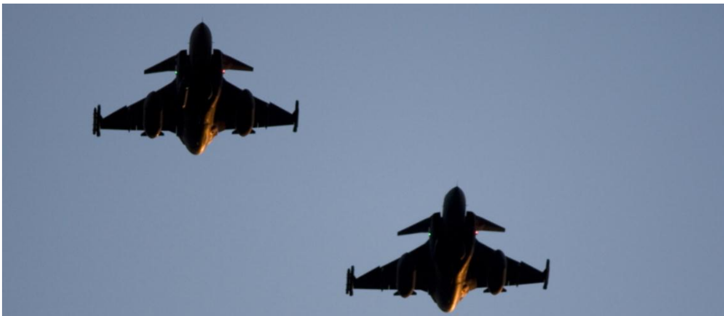
Två svenska JAS 39 Gripen under flygövningen Loyal Arrow som bland annat handlade om att förbereda Natos beredskapsförband.